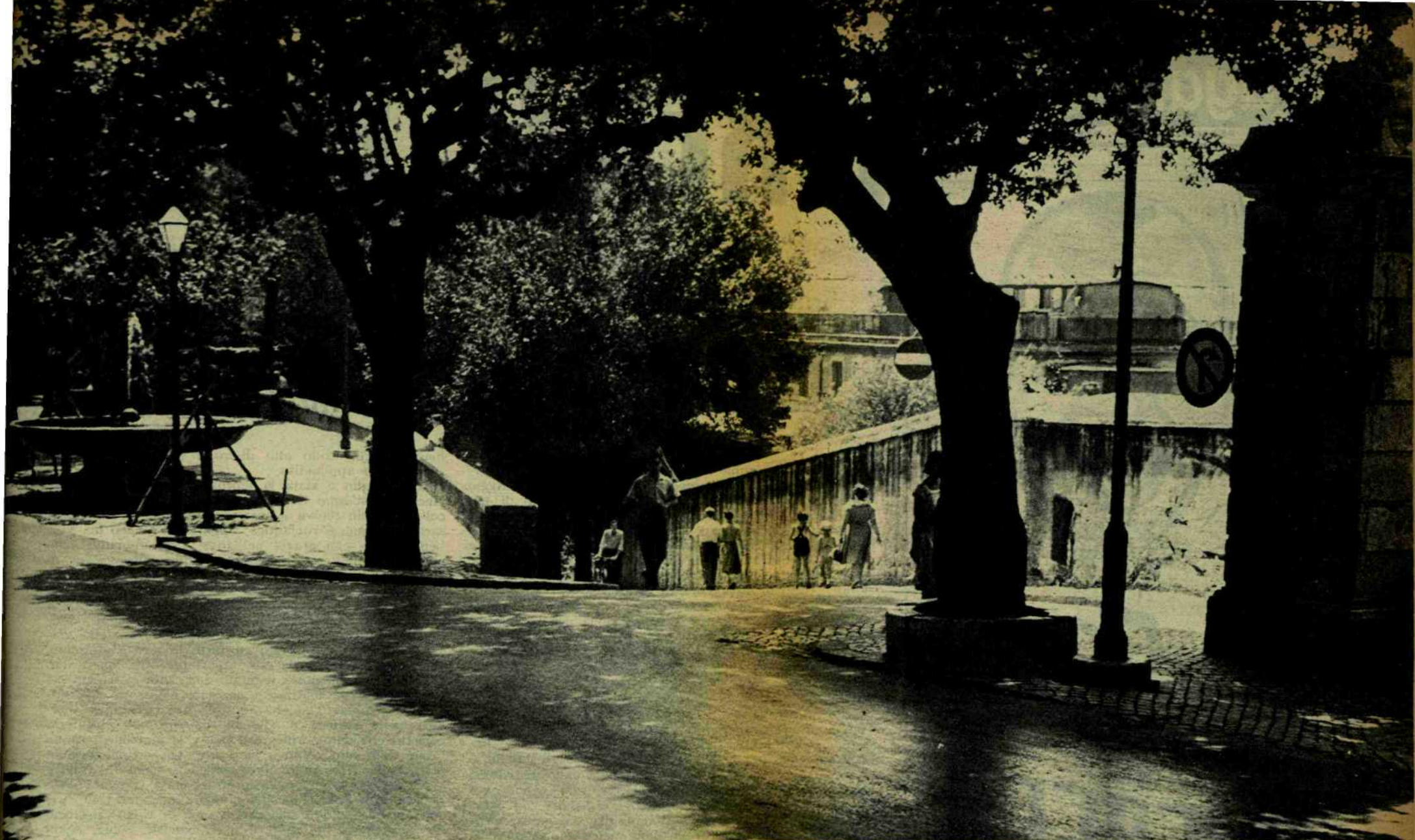
ROMA. Il Pincio con la parte alta di via San Sebastianello. La strada che scende da villa Medici a piazza di Spagna verrà distrutta.