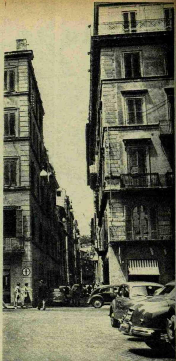
ROMA. Corso Umberto e via Vittoria. Via Vittoria, secondo il piano regolatore, sarà completamente distrutta. Cadranno anche i due palazzi d'angolo.

BEBÉ ETICHETTA AZZURRA DA SCIogliere NELLE PAPPE