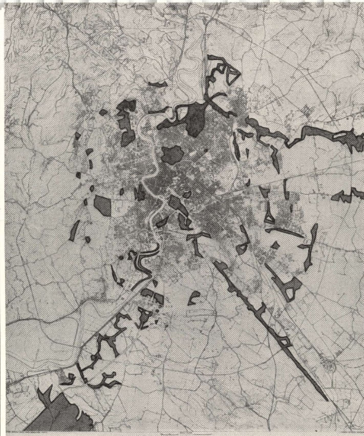
PRG 1959 I BRANDELLI DI VERDE PUBBLICO

I colli di Monte Verde Vecchio e Nuovo hanno avuto la stessa sorte di Monte Mario: gli alberi degli ospedali sono l'unico verde a disposizione degli abitanti. Più a occidente procede l'invasione massiccia della Valle del Casaleto, mentre Villa Doria-Pamphili, stroncata dalla via Olimpica, è ancora proprietà privata, nonostante il nuovo piano regolatore, le campagne di « Italia Nostra », eccetera. Sommerso sotto l'edilizia le ville dell'Aurelia Antica, cancellate per sempre le zone antiche alle spalle del Vaticano, i Monti della Creta, il Monte del Gallo, il colle del Gelsomino; distrutte da edifici religiosi abusivi (Studentato di Propaganda Fide) o autorizzati (Seminario americano, eccetera) tutte le pendici occidentali del Gianicolo. Lo sgangherato dilagare di Roma prosegue lungo l'Aurelia Nuova (più a