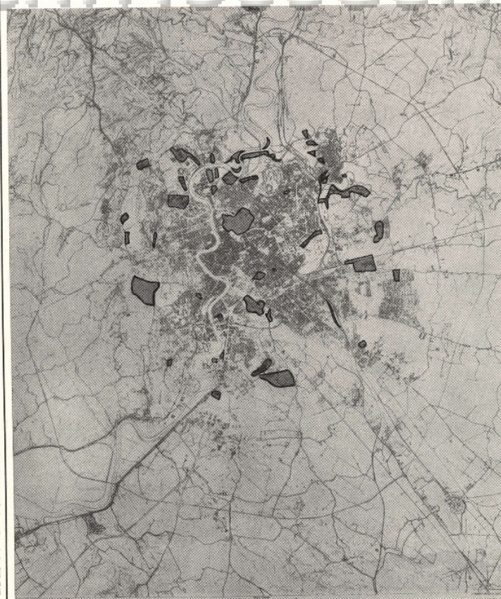
1931 IL VERDE PUBBLICO DEL PIANO

Anni in cui viene completato il distacco di Roma in base ai piani particolareggiati del Piano del '31, in cui vengono mandati a monte gli studi e progetti di nuovo piano elaborati dal Comitato Tecnico degli Urbanisti, e adottato il vergognoso piano regolatore del 1959 (10). Per limitarci all'essenziale, ricordiamo le occasioni che hanno dato origine alle maggiori battaglie politiche, e che, per quanto sfortunate, hanno favorito il formarsi di una maggiore coscienza nei riguardi del problema del verde, e meglio illuminato la protervia dei responsabili.