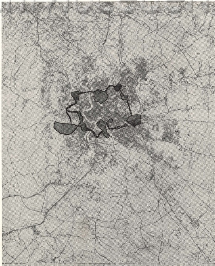
1916 L'ANELLO DEI PARCHI PROPOSTO DA M. PIACENTINI

parte dei boschi e dalla campagna, presentava condizioni ideali per quella integrazione sempre più stretta di città e natura che sarà l'aspetto fondamentale della cultura urbanistica moderna; e in effetti le proposte che furono avanzate nei rari momenti in cui l'urgenza del problema fu avvertita si sono sempre basate sulla necessità di sfruttare e rendere stabile quella felice situazione di partenza.