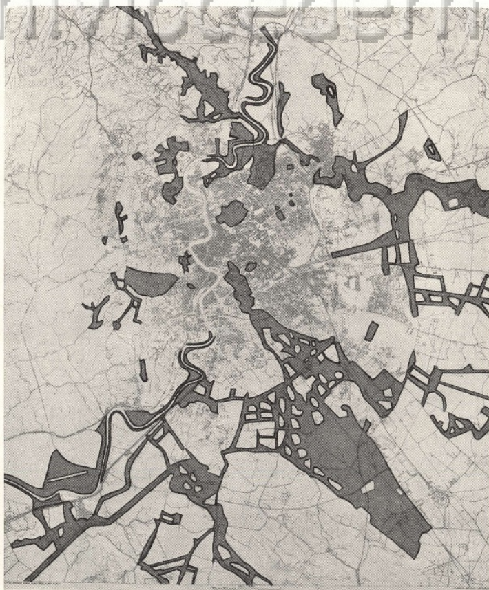
1962 IL VERDE PUBBLICO NEL NUOVO PRG