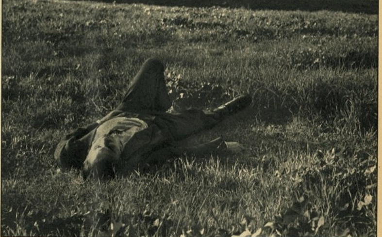
Roma. Villa Borghese. Una giornata di sciocco.

Basterebbe questo, credo, a dimostrare che se i luoghi scelti da Conrad per collocare l'azione dei suoi racconti sono lontani da noi, non sono meno lontani dall'esotismo. Descrizioni compiaciute si cercherebbero inutilmente nei suoi libri: tra l'uomo e il paesaggio si forma un rapporto che ha il fine, anch'esso, di mettere pienamente in luce l'uomo. L'esempio di maggiore evidenza è dato in Typhoon , in cui le fasi del tifone non sono una descrizione ma una vera e propria azione contro cui l'uomo reagisce. La meta è un personaggio del racconto, ma, nonostante il titolo, è un personaggio secondario; alla fine, chi esce illuminato da una piena chiarificazione è l'uomo, il capitano della nave, che contro il tifone è solo, i suoi badi, nonostante la presenza dell'equipaggio.