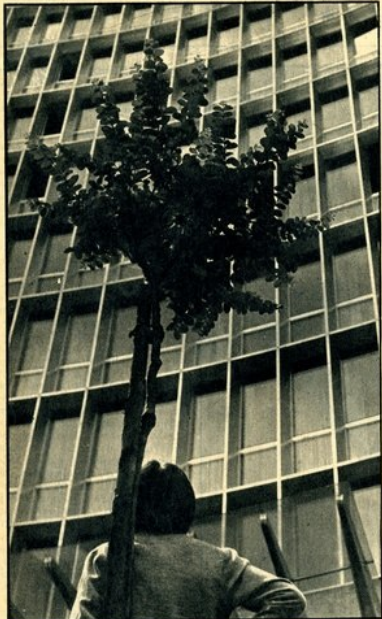
Milano. Il «verde pubblico» previsto dal nuovo piano regolatore.

un paio di brutte carte topografiche, concludevano la storica rievocazione due fanciulle vere, vestite da Lucia Mondella, o qualcosa del genere, che oziosamente sedute presso l'uscita, sudando per l'eccessivo riscaldamento.