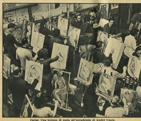
Parigi. Una lezione di nudo all'Accademia di André Lhote.