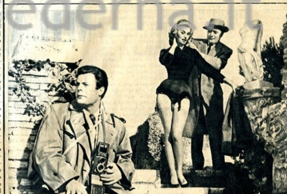
Diverente, piacevole, gustoso «La fortuna di essere donna» il nuovo film di Alessandro Blasetti, prodotto dalla Documenta, interpretato da Sophia Loren, Charles Boyer e Marcello Mastroianni, non è solo un divertimento, ma qualcosa di più: un'indagine gradevole, intelligente e sincera, nel mondo e nell'animo di certi giovani moderni.