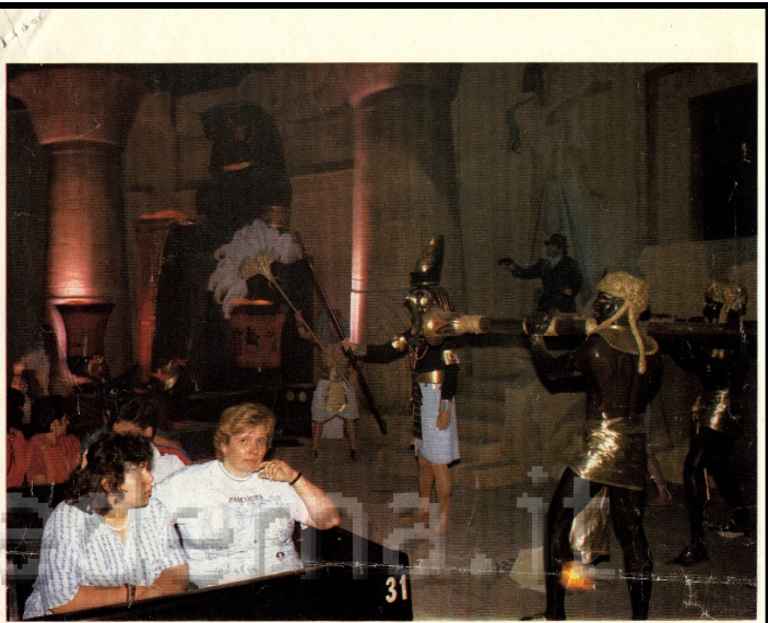
Sfiorando mummie, scheletri e manichini che si muovono e cantano, i visitatori vengono trasportati su speciali carrellini fra corridoi e tunnel. I manichini sono in grado di compiere fino a quindici movimenti e di parlare. Dopo i faraoni, nella "Disneyland" di Peschiera del Garda arriveranno anche più di cento pirati che si daranno battaglia scambiandosi cannonate sulla testa degli spettatori

microcosmo». Si chiama Fantalandia, offrirà al visitatore un laboratorio con le macchine di Leonardo, la ricostruzione di un borgo medievale con caravella di Colombo, un'esplorazione spaziale con «luna gigante» e un viaggio in orbita «con effetti speciali», un'avventura nel futuro su un'astronave e base spaziale ambientata su un «ipotetico pianeta»; un viaggio nel corpo umano all'interno di un gigante lungo quaranta metri; una «foresta di fiori pagliani», e molto altro ancora. Il tutto collegato con mezzi gommati «a forma di bruco». Il "parco" più stravagante sarà il Millennium, approvato all'unanimità dal consiglio comunale di Codigoro, in provincia di Ferrara, in aprile. Sorgerà su duecento ettari a poche decine di metri dall'Abbazia di Pomposa: ispiratore il ferrarese Carlo Rambaldi, al quale i molti premi Oscar devono aver dato alla testa: costo previsto trecento miliardi, capitali, a quanto si dice, per metà italiani (Rambaldi, Gardini), per metà svizzeri, tedeschi, americani. Sarà «ricostruita» la vita preistorica,