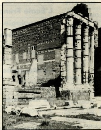
Le temple de Mars Ultor sur le forum d'Auguste.

Une continuité démontrée parce qu'entièrement programmée.