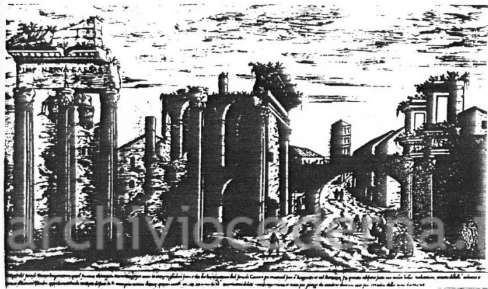
Veduta del tempio di Minerva nel Foro di Nerva (demolito nel 1606); si scorgono anche le "Colonnacce" e l' Arcus Aureae_ S. Du Perac, I vestigi dell'antichità di Roma, 1557, Tav.6.