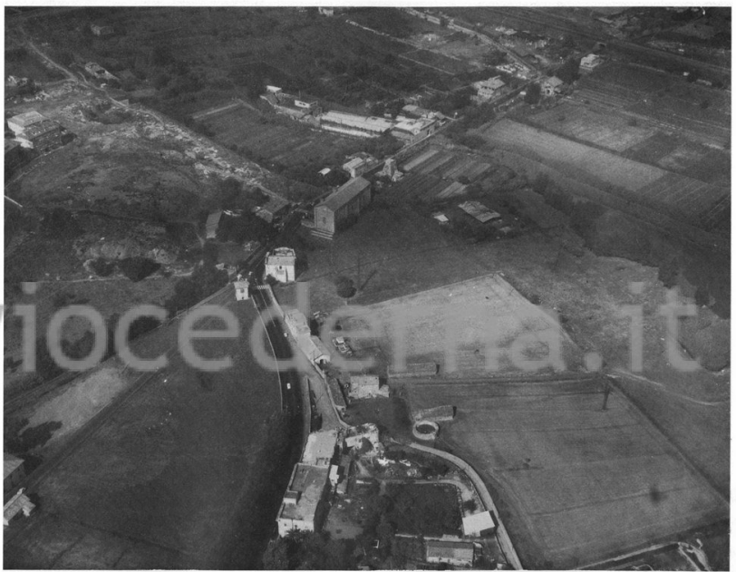
Fig. 3 - La zona del « Domine quo vadis? »: in basso, a destra, il Vicolo della Caffarella