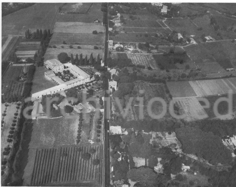
Fig. 4 - Il tratto in corrispondenza delle Catacombe di S. Callisto

Umberto Zanotti Bianco per reperire fondi all'estero fu bocciata per boria nazionalistica, un'altra proposta di esproprio dei duemila e più ettari del comprensorio cadde col solito pretesto della mancanza di fondi (ma la stima del costo globale era stata basata sul valore edificabile e non su quello derivante dai vincoli che erano stati posti). Quanto al Piano Paesistico, una prima stesura esposta in Comune nel settembre del '55 non piacque ai benpensanti e