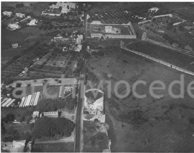
Fig. 6 - Il tratto dalla Tomba di Romolo al Mausoleo di Cecilia Metella

... un minimo decoro ambientale, e nem- tu... la nettezza urbana. ... la creazione del Parco dell'Appia esige dun- sta... oltre che decisione e convinzione politica, un p... ovamento degli apparati comunali, che ... tecnico e culturalmente inadatti al ... deve essere assunta come impegno pri- ... politici e amministratori per lo stesso ... perché la distanza da Terzo