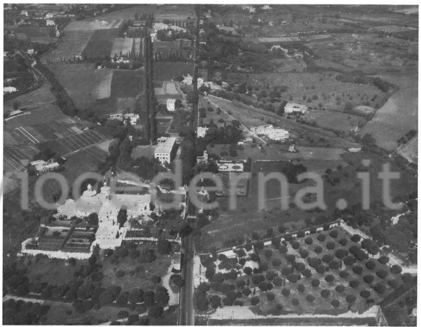
Fig. 5 - La zona della Basilica di S. Sebastiano

Dicono che non si deve « cristallizzare » l'ambiente, perché « la vita è continuo divenire »: trasformando l'Appia Antica in parco, diventerebbe « urbanisticamente defunta » (!), per di più « teatro di imprese criminose », un problema di ordine pubblico: e del resto, anche se si trovassero i miliardi necessari, l'Appia sarebbe ingovernabile, proprietà di tutti e di nessuno, e via dicendo. Una filosofia dalla quale si deduce che il divenire ovvero il progresso consiste nella cementificazione delle aree libere, che la morale si difende con le ville signorili, e che l'unica proprietà ammessa è quella dei pochi privilegiati, dal momento che la proprietà pubblica, il demanio, il parco, anziché un patrimonio prezioso e una risorsa inalienabile per la vita stessa di milioni di