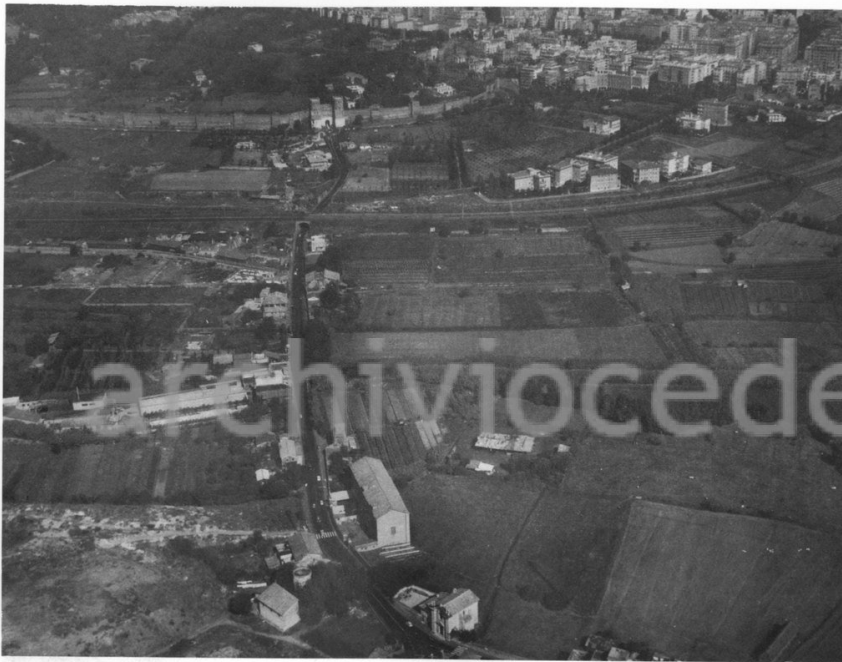
Fig 2 - Il tratto dalle Mura al « Domine quo vadis? »

zione si decisero a emanare il 14 dicembre 1953, dopo l'inizio della campagna di stampa sul settimanale « Il Mondo ».