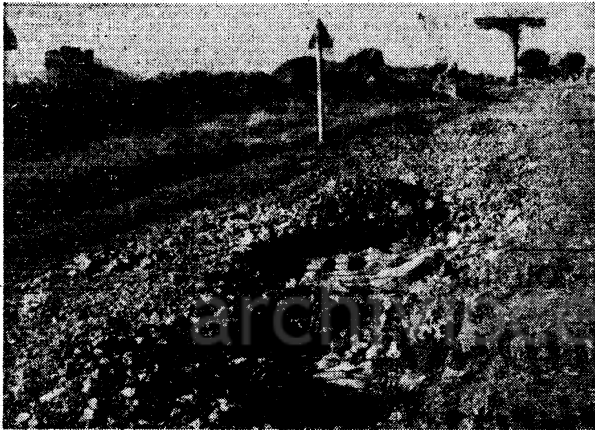
Ecco i risultati di un anno e mezzo di lavori: un piccolo tratto di basolate antiche

Si invita il Ministro della Pubblica Istruzione ad intervenire personalmente per svegliare dal suo lungo torpore il Consiglio Superiore delle Antichità e Belle Arti