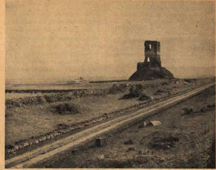
Nella fotografia « Alinari » qui in alto e nella nostra illustrazione in basso lo stesso punto dell'Appia Antica è colto a distanza di mezzo secolo. La patetica carrozzabile si è asfaltata e popolata di veloci automobili e rombanti motorette, mentre la città ha avanzato i suoi bianchi tentacoli là dove, prima, era aperta campagna. Al romanticismo ancora ottocentesco, dei ruderi monumentali e delle nobili ville, subentra il dinamismo cementizio e motoristico di questa, ch'è già vigilia del Duemila. Riuscirà, la Regina Viarum, a salvare il volto e l'anima? Ben difficile è il compito delle Autorità cui spetta di distinguere, nell'intrico dei contrapposti cori polemici, dove finisce la disinteressata difesa dei puri valori estetici e dove comincia, più o meno consapevolmente, quella di ben più materiali interessi. È stato adombrato, per esempio, che, ad allargare quanto più possibile la zona non edificabile dell'Appia, possa concorrere, insieme alle apprezzabili e universalmente apprezzate istanze paesaggistiche, la pressione, anche, di forze economiche interessate alla valorizzazione di altre zone: qualche cosa di analogo agli ostacoli ed ai ritardi frapposti allo sviluppo edilizio della zona E.U.R.