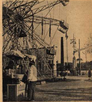
Molti temono che l'Appia finisca come la Zona Archeologica (qui in alto), demurata da giostristi e gelatai. Qui accanto: l'edificio color fragola dell'Opera Pia Don Guanella, la cui costruzione fu autorizzata dall'allora ministro Gonella contro il parere della Direzione Belle Arti. Qui sotto: la planimetria del Piano Regolatore.