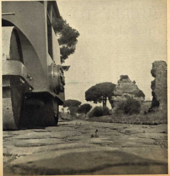
LAVORI IN CORSO - Gli interventi del Comune per la tutela dell'Appia Antica

Prima conseguenza della campagna suscitata dal settimanale radicale fu la composizione della Commissione