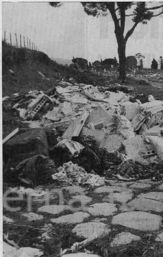
Si parla tanto dei mega-progetti sul parco dell'Appia