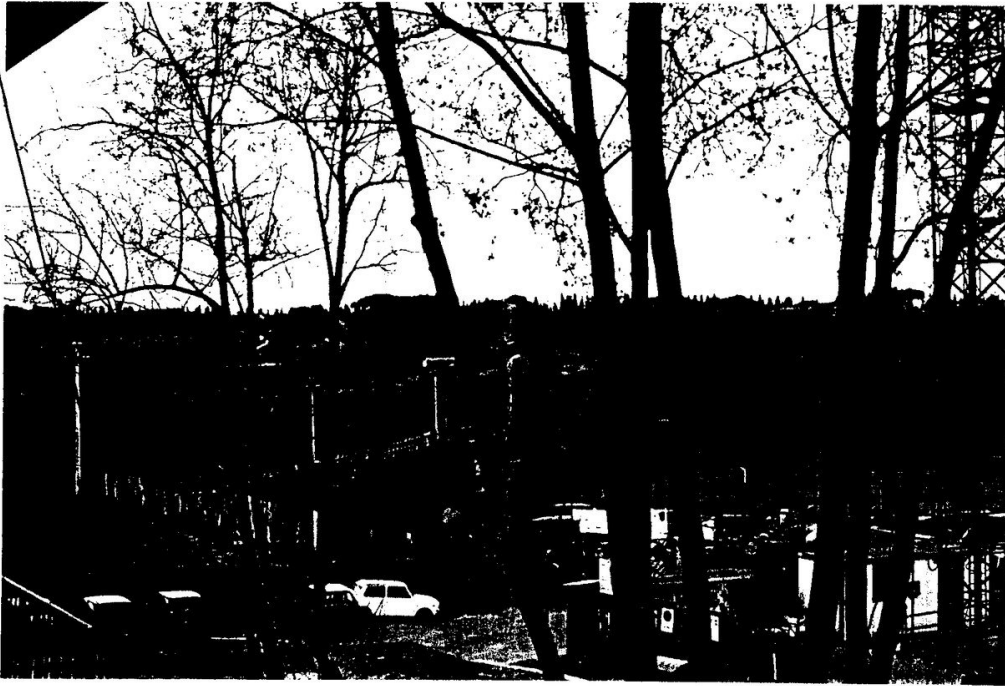
1 Recinzione in lamiera (vista dall'alto)