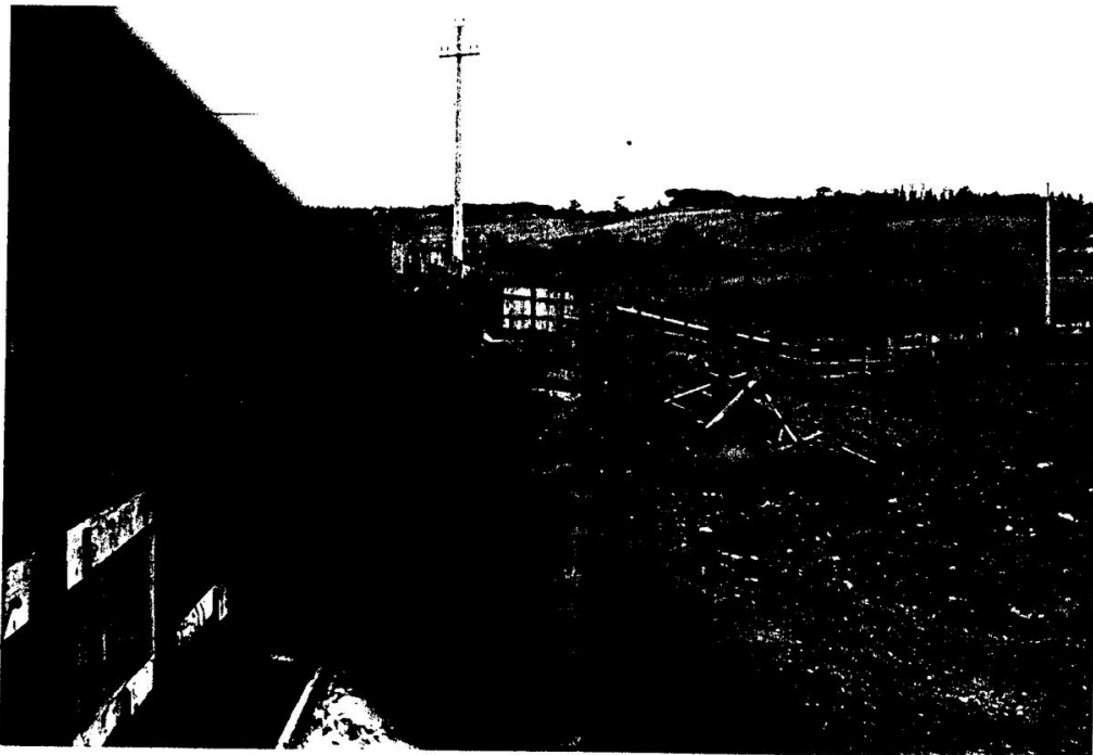
2 Recinzione in lamiera (vista attraverso il cancello d'ingresso)