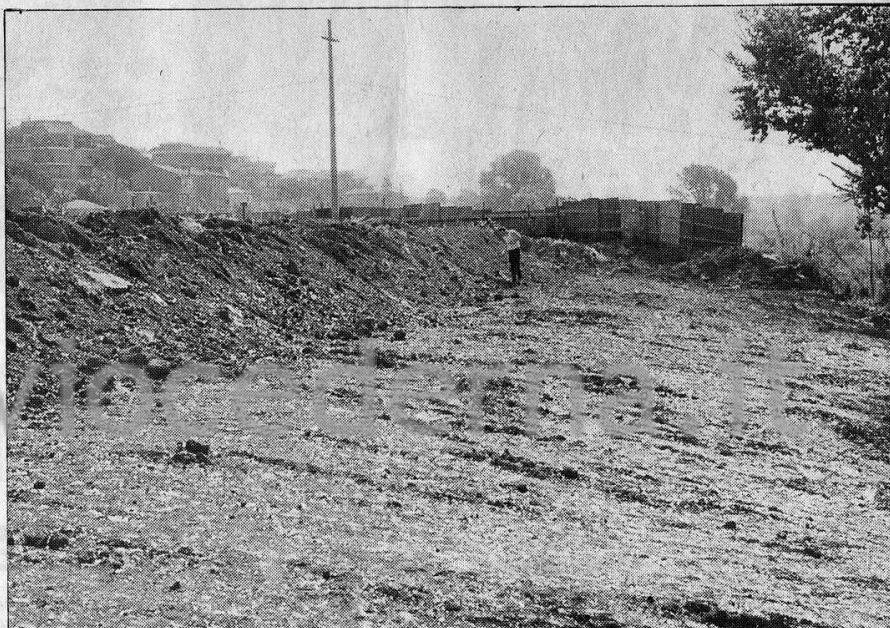
I lavori di sterro con grandi movimenti di terra contestati: avrebbero comportato la deviazione del corso di una marrana