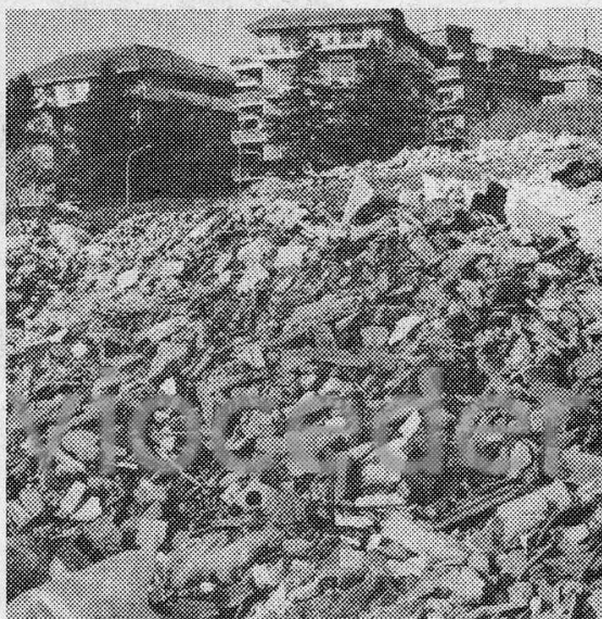
Ecco com'era ridotta la Caffarella: una discarica

Gli aderenti al Comitato per la salvaguardia del parco sono molto scettici: «Le nostre preoccupazioni — dicono — sono tre. La prima è che il Comune